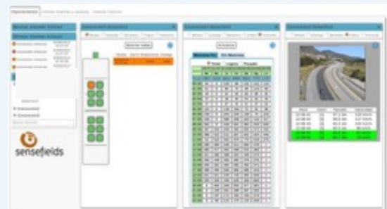
Software de control, visualización y análisis de los datos basado en tecnología web (FASTRACK)