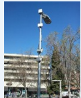
Estación de procesamiento de datos (DPS)